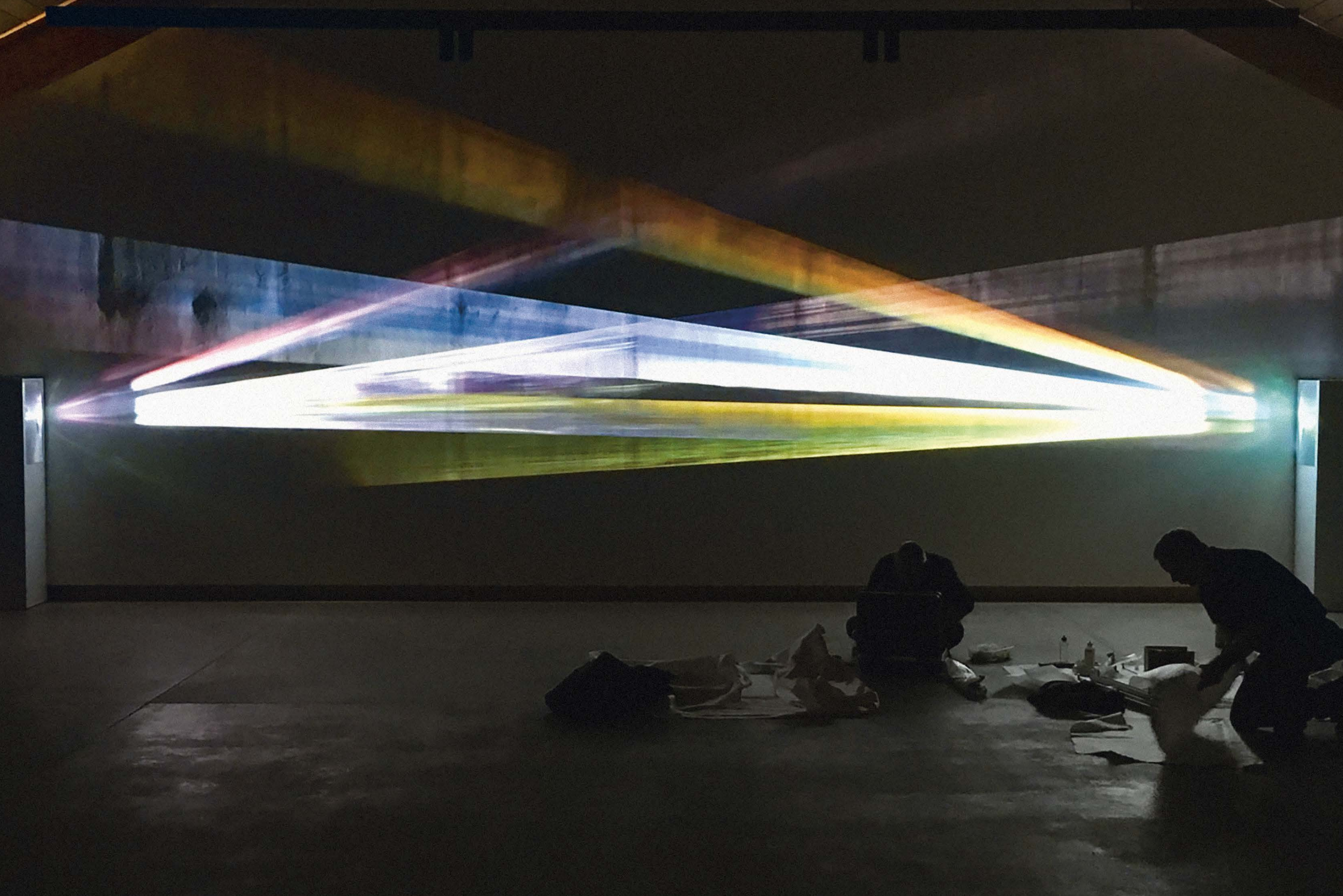
Mischa Kuball, re-FLEX-ionen, in situ-Projekt für das Lange Haus, 2017